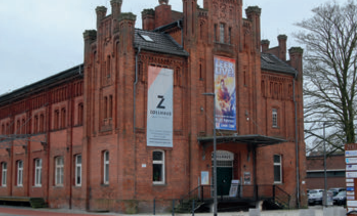
Historische Zollstation Leer - heute Kulturzentrum