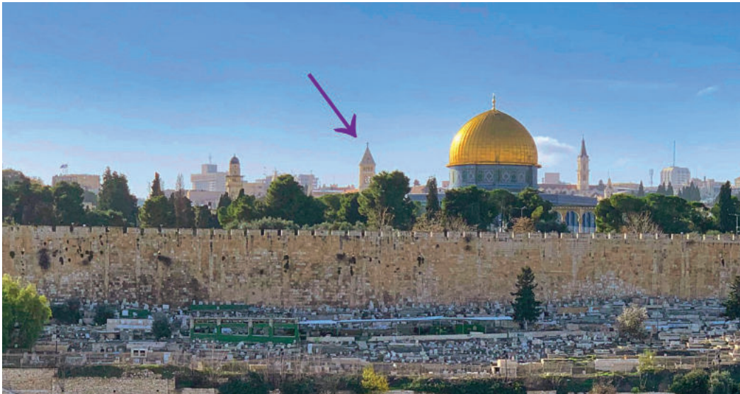
Skyline mit Erlöserkirche (Pfeil)