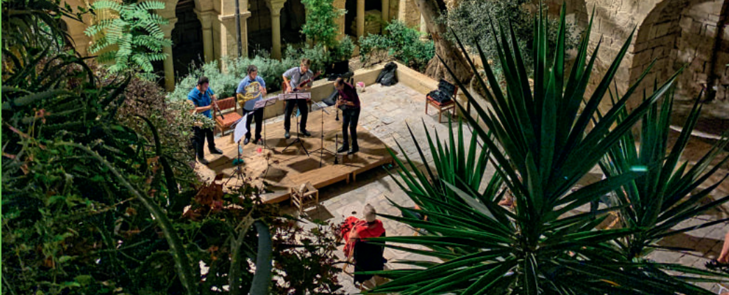
Konzert in Jerusalem