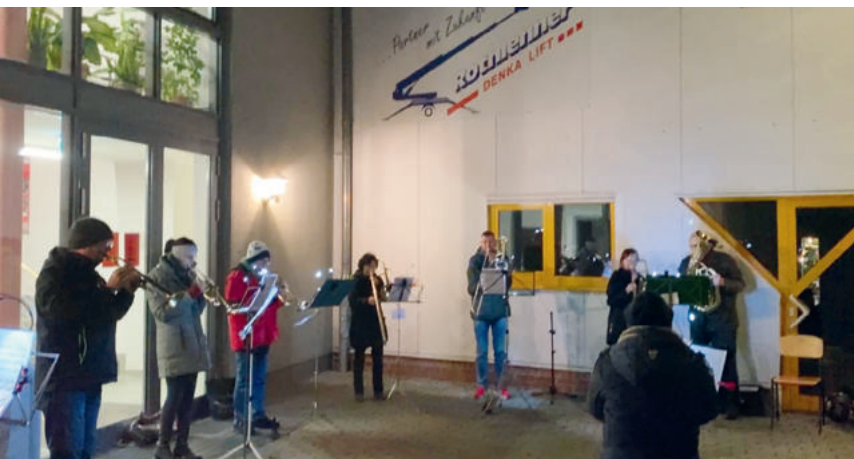
Unser Posaunenchor sorgte mit weihnachtlichen Liedern für festliche Stimmung.