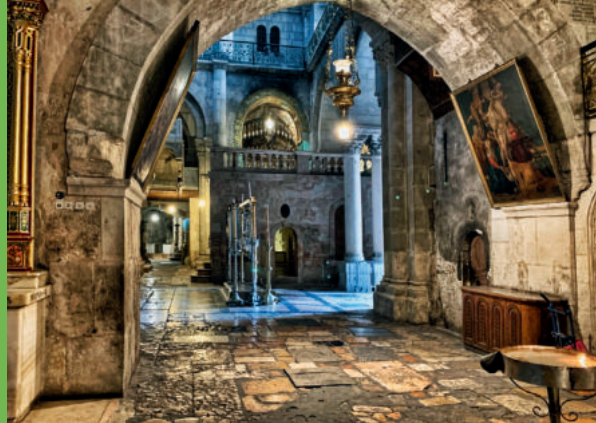
Leere Grabeskirche auf Golgatha während des Lockdown.

sie von jüdischen Familien gekauft wurden. Das ist nicht alles in Viertel schön sortiert, aber das jeweilige Gepräge ist ein eigenes.