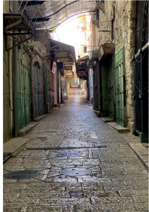
Davidstraße ebenfalls während des Lockdown aufgenommen.

Wir wissen noch nicht, wie es Ostern sein wird. Wir haben die traditionellen Angebote in den Gottesdienstplan genommen. Aber all die schönen Sachen drumherum wie das Osterfrühstück wird wohl noch nicht gehen.