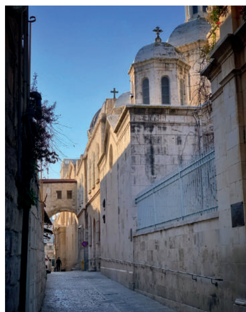
Die Via Dolorosa