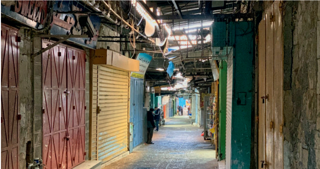
Basarstraße in Jerusalem während des Lockdown.

hinweg: Sie wollen dafürstehen, dass es nicht nur ein Gegeneinander gibt.