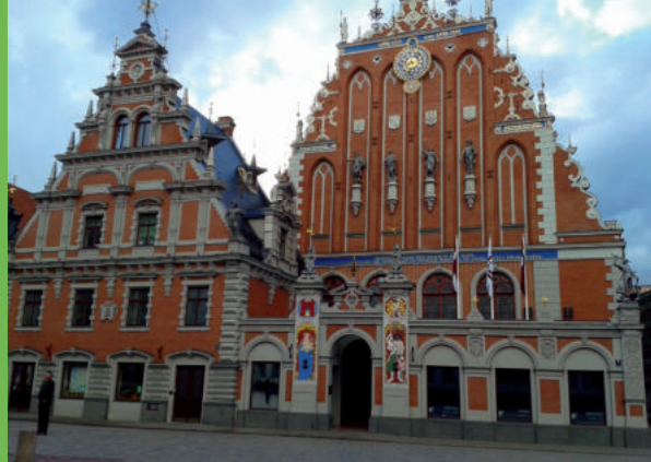
Das Schwarzhäupterhaus in Riga

aktuelle Probleme der Kommunal- und Agrarpolitik, der Aufbau der niedersächsischen Kommunalverfassung und auch sozial- und wirtschaftspolitische Probleme erörtert.