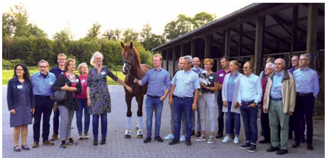
Gruppenbild mit Pferd