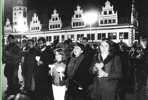
Teilnehmer eines Schweigemarsches am 9. November 1989