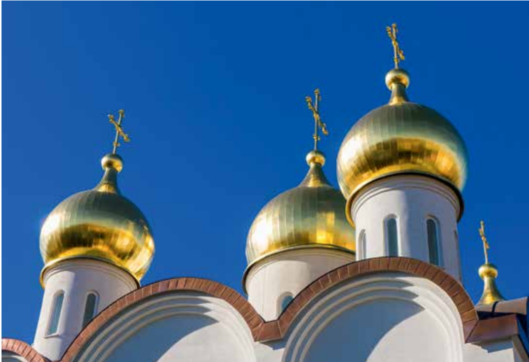
Russisch-Orthodoxe Kirche in Moskau.