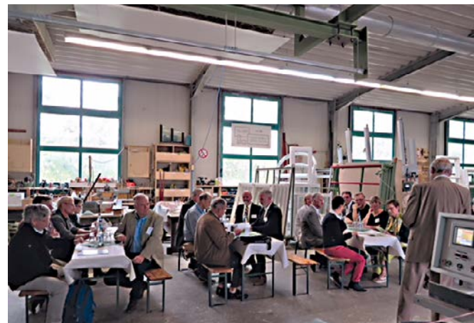
Ein Teil „der Belegschaft“ in der Werkstatt