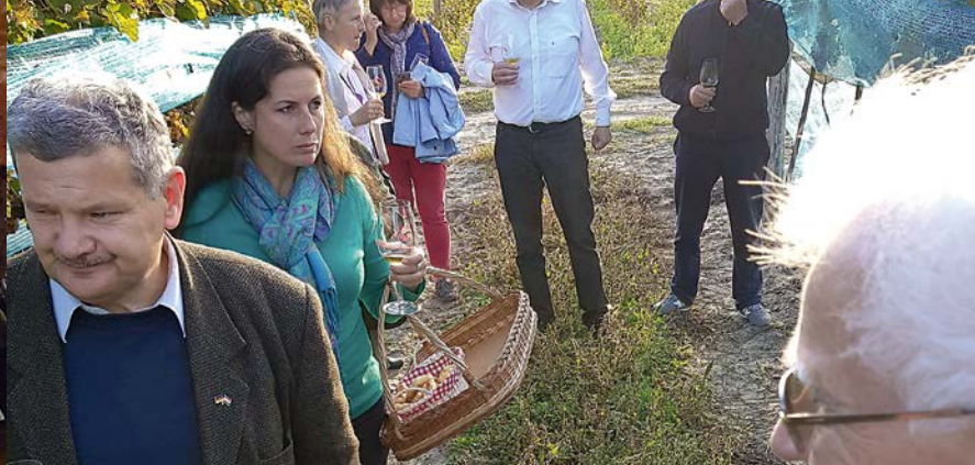
Weinprobe im Weinberg