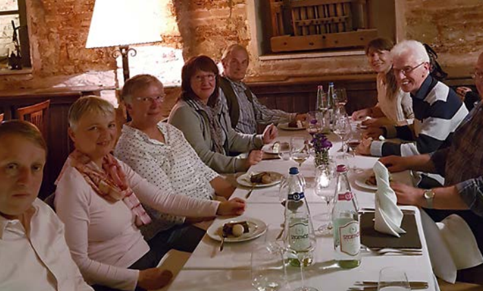
Unterwegs mit INITIATIVE – Abendessen in Balatonfüred