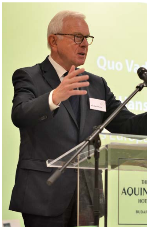
Prof. Dr. Hans-Gert Pöttering, ehemaliger Präsident des Europäischen Parlaments, während seines Vortrags zum Thema „Quo vadis Europa“.

Nebenbei: Budapest ist eine faszinierende Stadt. „Leider“ sehen nicht nur wir das so. Der samstagnachmittägliche Dauerstau während unserer Stadtrundfahrt war ebenfalls beeindruckend.