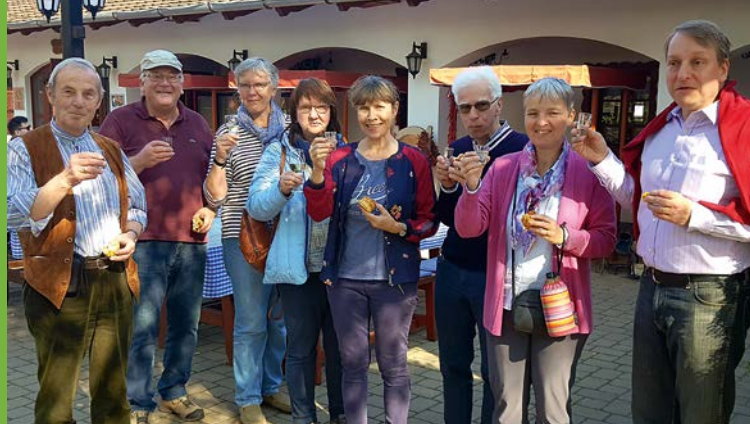
Die Reisegruppe vor dem Reitstall Lázár.