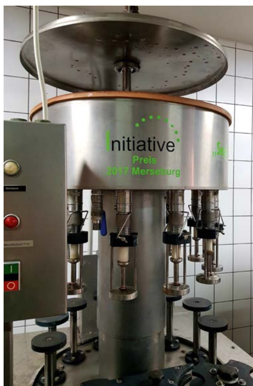
Die durch Mittel des Förderpreises im Jahre 2018 erworbene Flaschenabfüllmaschine.