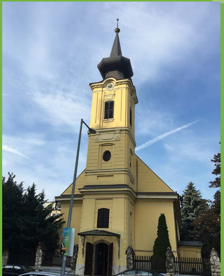
Reformierte Kirche von Óbuda, Kálvin köz 4, Budapest