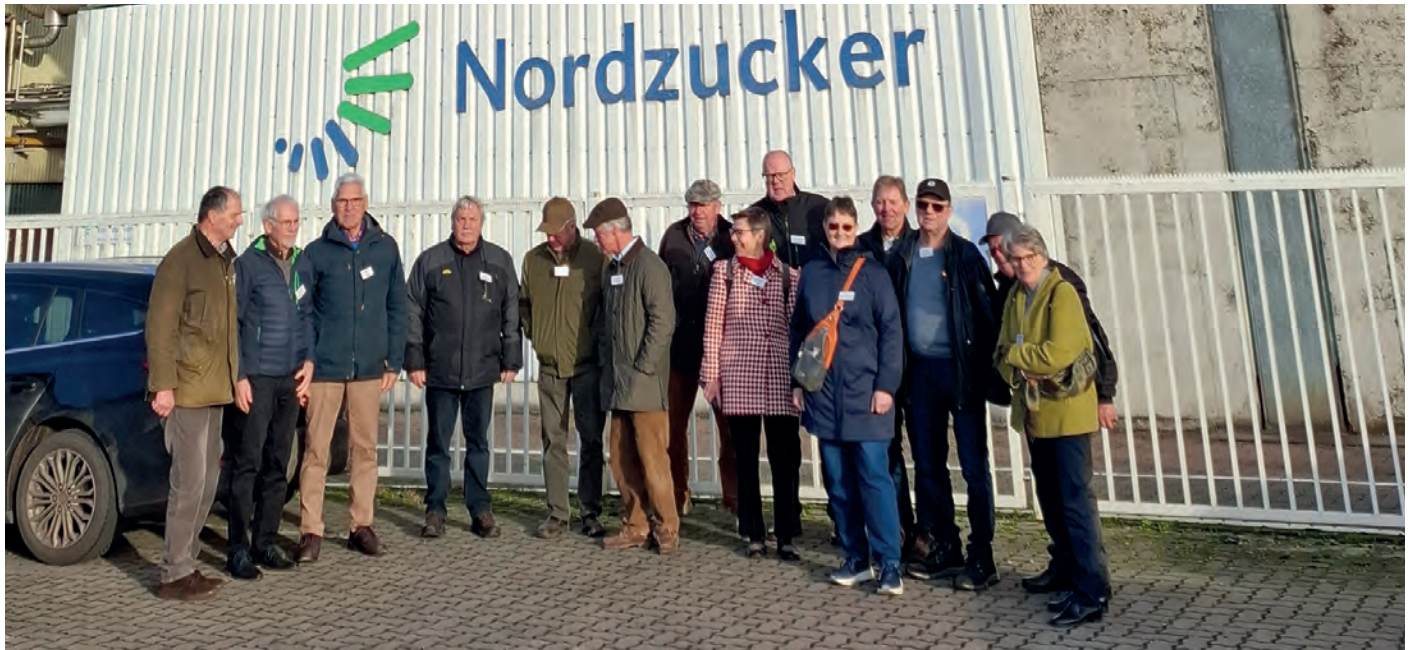
Erste Teilnehmende warten gespannt auf den Betriebsbesuch im Werk Clauen

Regionaltreffen Hannover-Braunschweig: Besuch Nordzucker AG Werk Clauen