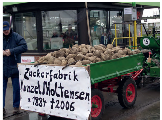
Letzte Rübe: Bauernproteste gegen die Werkschließung Groß Munzel

Aktuell zählen zur Nordzucker AG 20 Standorte weltweit. Bis in die 2000er Jahre erfolgte sukzessive die Verschmelzung einzelner kleinerer Zuckergesellschaften in den Konzern. Verbesserte Transportlogistik und kontinuierliche Modernisierung führten zur Konzentration auf wenige Standorte verbunden mit zahlreichen Werkschließungen.